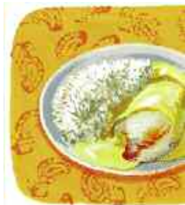
Escalope de poulet à la moutarde : préparez une sauce qui donne du goût...