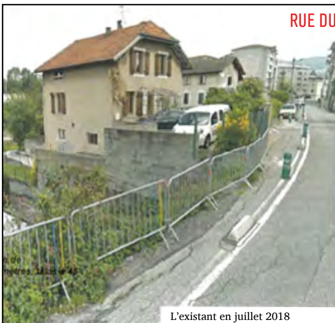
L'existant en juillet 2018

La mise en impasse de la rue du Mont Gosse obligeait les habitants de la rue du Planet à redescendre systématiquement vers la rue d'Étrembières, même s'ils allaient dans une direction opposée. Nous avons donc fait un aménagement qui leur permettait de rejoindre rapidement la route de Bonneville en utilisant la contre-allée.