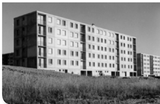
Le Livron autrefois...

En attendant, rendez-vous en décembre pour découvrir ensemble ce livre à la mémoire du Perrier.