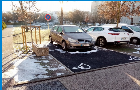
Place PMR - conservatoire