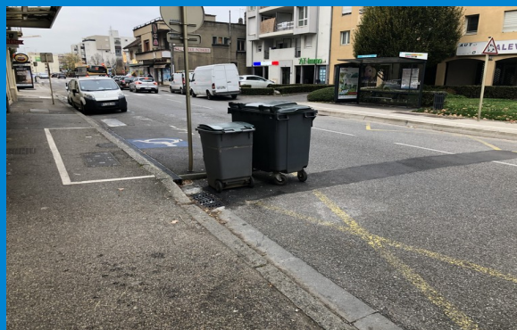
Place CMI suppression flaque d'eau rue de Geneve