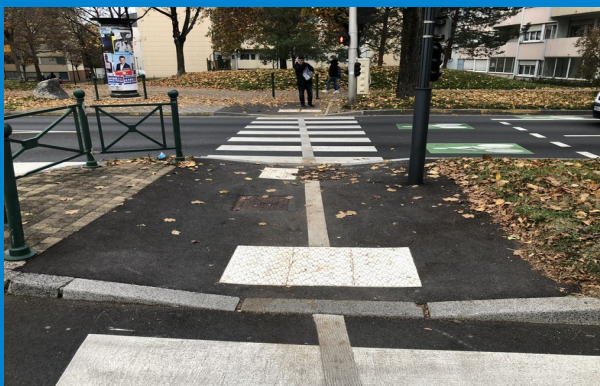
Av. De Gaulle / Leclerc