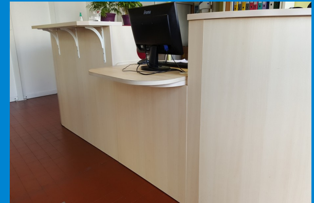
Banque d'accueil – MJC Centre