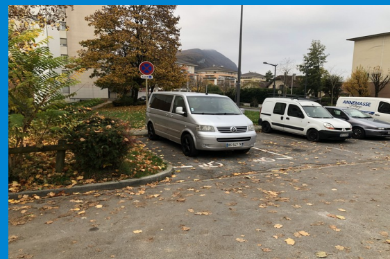
Place CMI – 45 av de Verdun