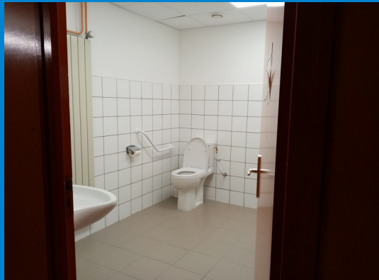
Sanitaire PMR - conservatoire