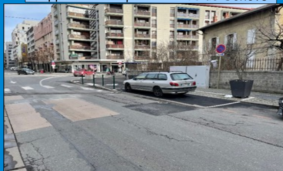
Place CMI 28 av. de la Gare